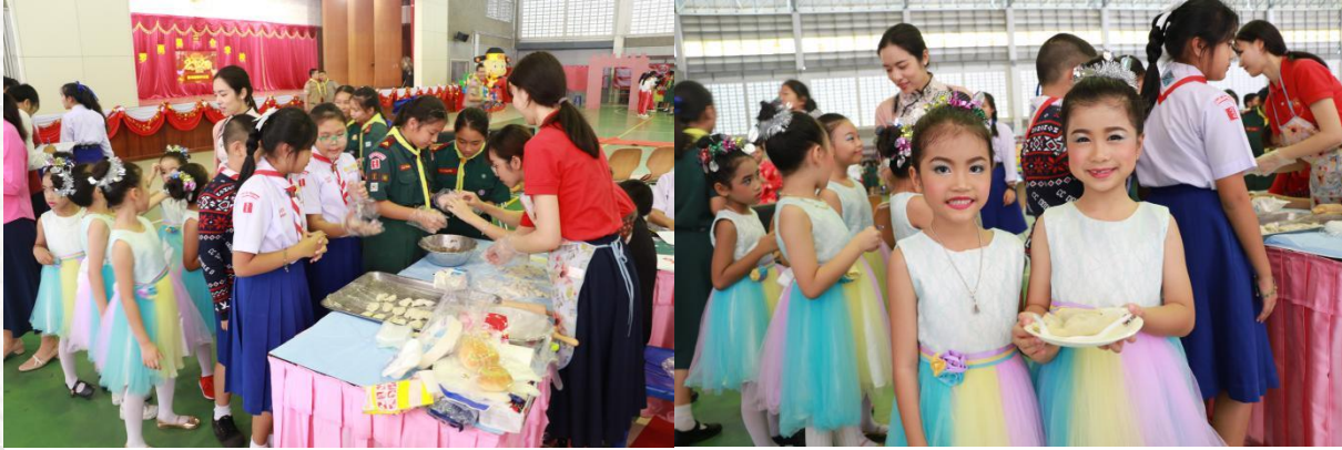
กิจกรรมเฉลิมฉลองเทศกาลตรุษจีน