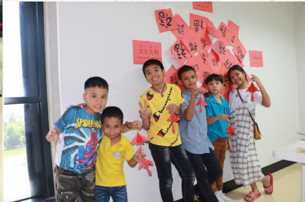
ภาพกิจกรรมวิชาวัฒนธรรมต่างๆ เช่น ถักเชือก ตัดกระดาษ รำไทเก๊ก เป็นต้น