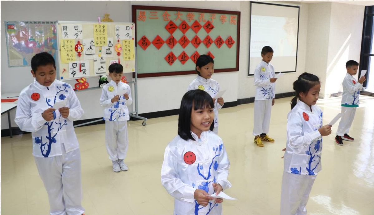
การแสดงร้องเพลงจีนของเด็กๆ