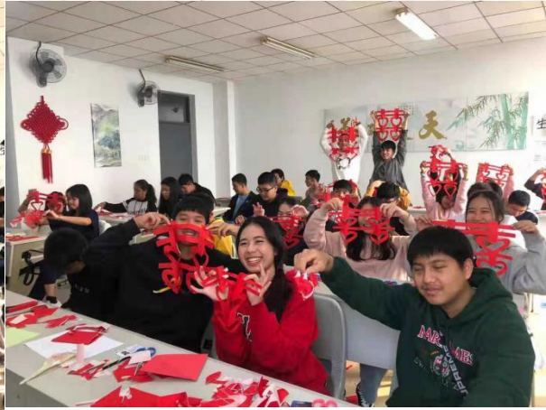
ภาพกิจกรรมในห้องเรียน ณ มหาวิทยาลัยวิทยาศาสตร์และเทคโนโลยีเทียนจิน