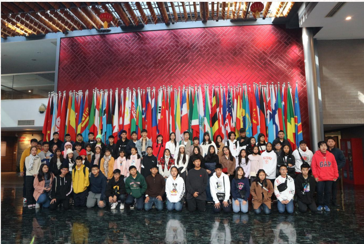
ภาพรวมหมู่คณะ ณ สถาบันส่งเสริมการเรียนการสอนภาษาจีนนานาชาติ สำนักงานใหญ่

เพื่อเป็นการเพิ่มความรู้ด้านภาษาและวัฒนธรรมจีนเพิ่มมากขึ้น มหาวิทยาลัยวิทยาศาสตร์และเทคโนโลยีเทียนจิน ได้จัดวิชาภาษาจีนพื้นฐาน วิชาภาษาจีนทั่วไป วิชาการมวยไทเก๊ก วิชาเขียนพู่กันจีน วิชาวาดรูป วิชาตัดกระดาษ เป็นต้น นอกจากนี้ยังได้จัดให้เข้าชมสถานที่ต่างๆ เช่น สำนักงานใหญ่สถาบันส่งเสริมการเรียนการสอนภาษาจีนนานาชาติ พิพิธภัณฑ์เทียนจิน และกำแพงเมืองจินด่าน หวงหยากวน ณ กรุงปักกิ่ง