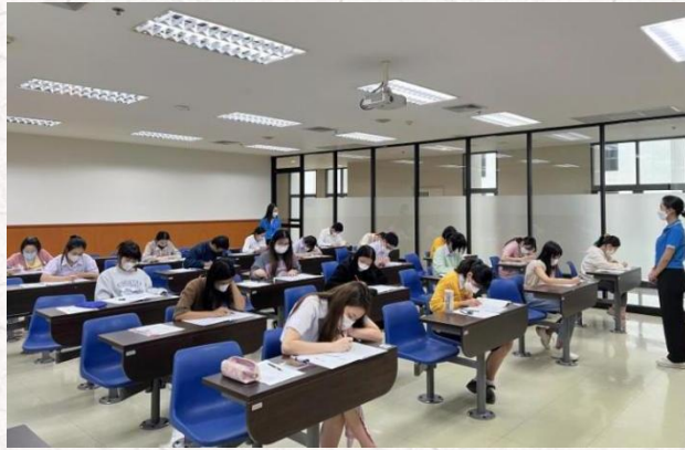
易三仓大学考试现场

此次考试，汉考国际要求参加 HSK 三级及以上级别考生需参加中文水平口语考试（HSKK），易三仓大学孔子学院有 80 名考生参加了 HSKK 初、中、高级考试。