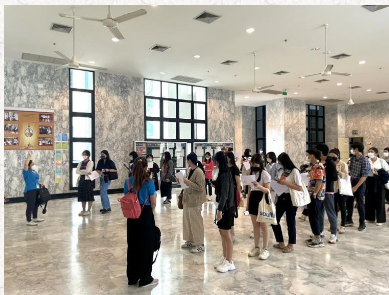
易三仓大学孔子学院监考教师组织考生前往考场

考试当天，考生提前 1 小时到达考场，配合监考人员完成身份核验等工作，并在监考老师的带领下，依次、有序地进入考场就坐。