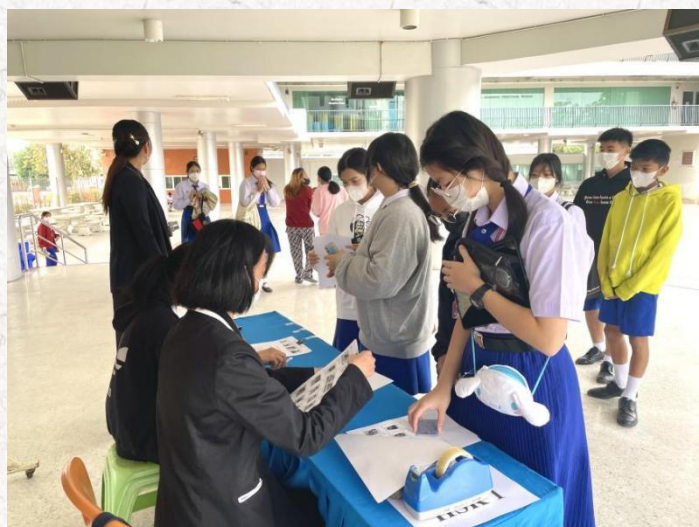
呵叻易三仓学校监考教师核查考生身份

考试当天，考生提前 1 小时到达考场，配合监考人员完成身份核验等工作，并在监考老师的带领下，依次、有序地进入考场就坐。