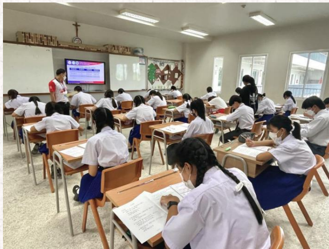
呵叻易三仓学校考试现场

考试期间，监考老师严格遵守考务工作流程和相关考试规定，所有考生严格遵守考场纪律，认真作答，无违规违纪现象出现。在监考老师和所有考生的共同努力下，本次考试圆满结束。