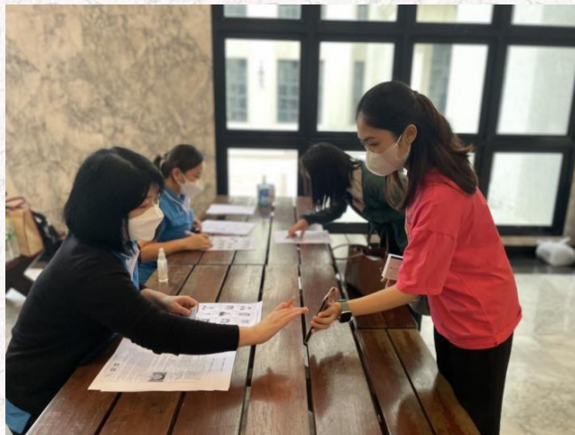
易三仓大学孔子学院监考教师核查考生身份

此次考试，汉考国际要求参加 HSK 三级及以上级别考生需参加中文水平口语考试（HSKK），易三仓大学孔子学院有 80 名考生参加了 HSKK 初、中、高级考试。