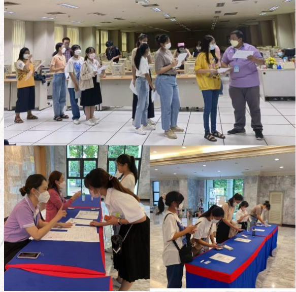
易三仓大学 HSK 机考现场

考试当天，易三仓大学孔子学院组织所有考生及监考人员进行 ATK 测试，并要求考试过程中监考人员及考生全程佩戴口罩。在完成体温检测，手部消毒，身份核验后，考生在监考老师的指引下进入考场就座。