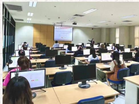
考生接受考试系统操作指导