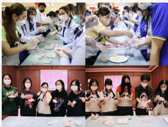
中国传统美食制作

为迎接参加 2022 年“孔子学院日”庆祝活动的师生们，易三仓大学孔子学院准备了中文体验、书法、团扇、脸谱、油纸伞、门环、中国结、手绳、折纸、古筝、武术、中国传统美食制作等丰富多彩的庆祝活动。同学们不仅在活动中学习了中文，还对中华文化有了更深刻认识。