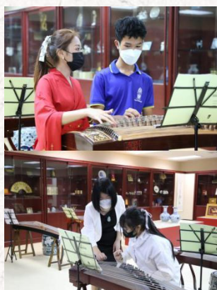
中国传统乐器体验