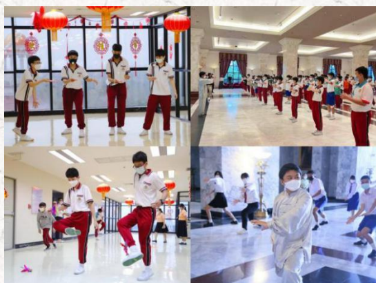
中国传统体育项目体验