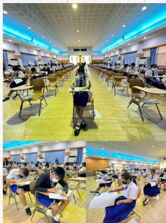
罗勇易三仓学校 HSK 纸笔考试现场

在考前准备工作期间，为确保考试的顺利进行，易三仓大学孔子学院联合易三仓大学计算机中心，对 HSK 现场机考设备及系统进行全面检查及测试。罗勇易三仓学校组织该校监考老师进行 HSK 考务培训，并详细讲解了考试流程及监考要求。