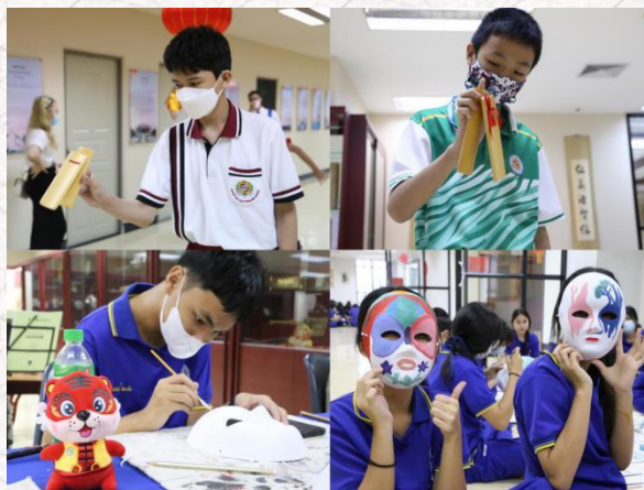
中国传统曲艺项目体验