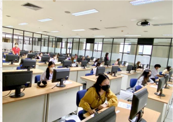
易三仓大学孔子学院 HSK 考试现场

2022 年 10 月 16 日，易三仓大学孔子学院举办 HSK 和 HSKK 现场机考。本次考试共有 64 人考生参加，考试级别包括 HSK 3-6 级和 HSKK 中级-高级。