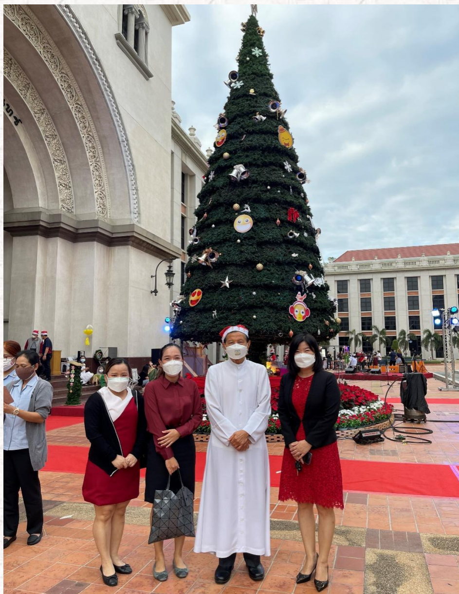
易三仓大学孔子学院参加易三仓大学圣诞树点灯仪式